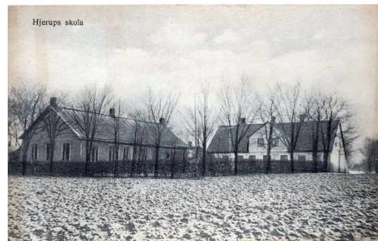
t h Gamla skolan som byggts om till lärarbostad t.v Nya skolan byggd 1892

Skolan med lärarbostaden ansågs vara för liten och år 1892 byggdes en ny skola och hela den gamla byggnaden gjordes om till lärarbostad.