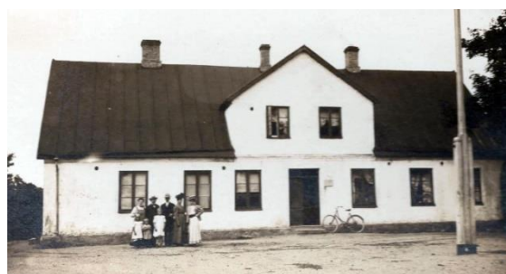
Nya skolan med lärarbostad. Byggt år 1848

1848. Måtten var 19,5 x 8,5 m och det var uppförd på samma plats som den tidigare.