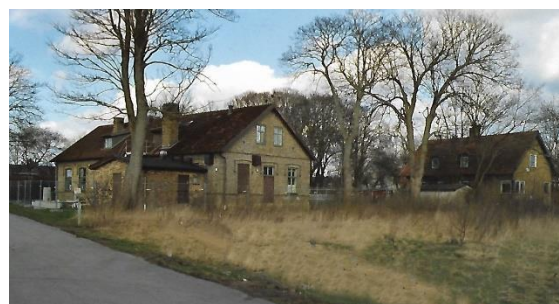
Skolan t v, nya lärarbostaden t h

Huset med lärarbostaden revs år 1936 men en ny lärarbostad hade byggts och dit flyttade familjen.