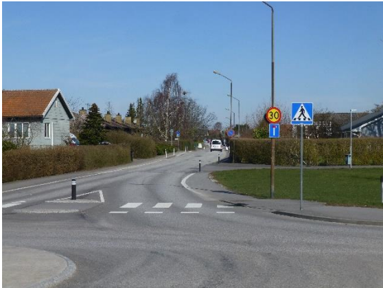
Klockaregårdsvägen mars 2020