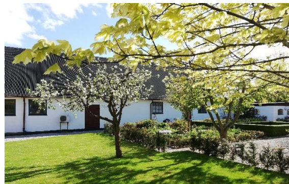
De tre bilderna av gården är tagna 2019