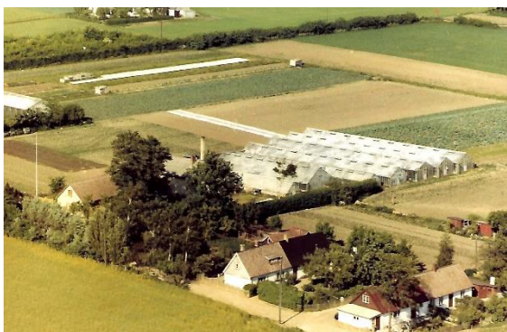
Bild från 1960-talet med gården i centrum