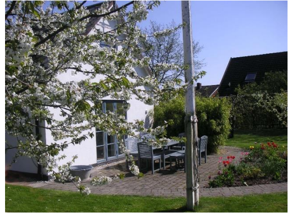
Fasad mot väster

Barnen är nu vuxna och har flyttat ut från huset.