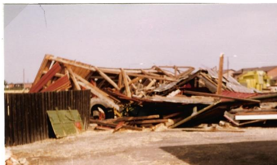
Före detta lada fotograferad från norr.

Påföljande morgon gick de ut och tittade på förödelsen igen och hade kamera med sig.