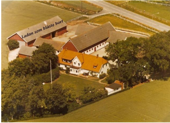
Gården före stormen