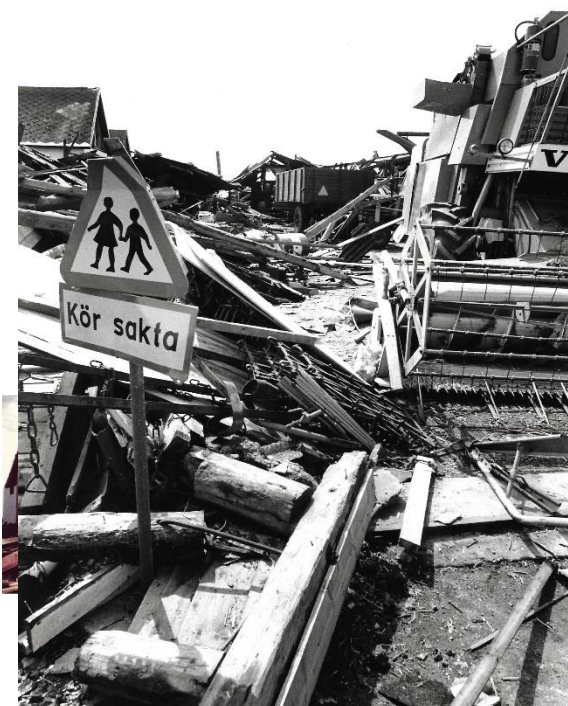
Samma före detta lada fotograferad från söder

Garageportarna stod öppna och bilens bakruta hade krossats av kringflygande takpannor.