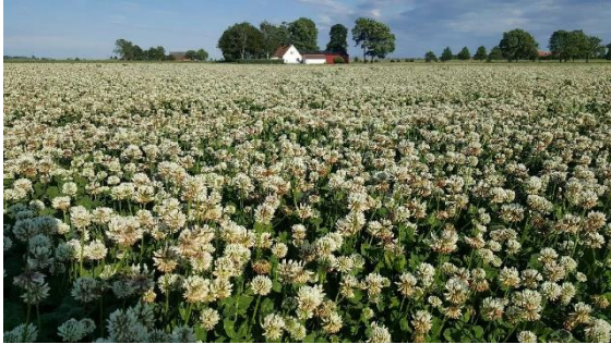
Ett fält med vitklöver

annorlunda därför att klöver och ett sädeslag sås samtidigt på våren. När säden är mogen på sensommaren skördas den och på marken finns låga plantor av klöver. När säden är skördad får de plantorna mer ljus och växer till sig för att skördas året därpå. Under tiden som klöverna växer tillför den också kväve till jorden.